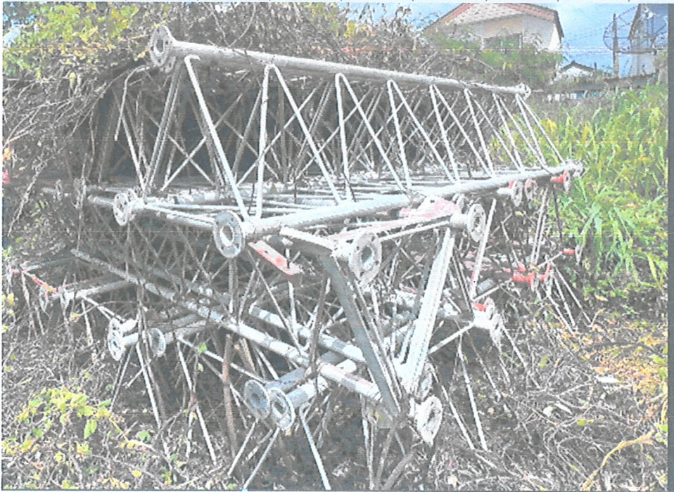
รูปภาพ (กลุ่มที่ 2)