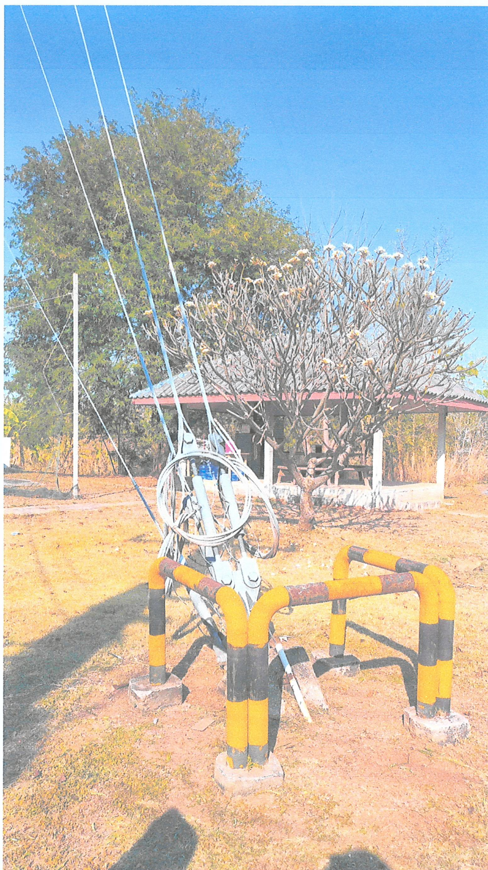
ภาพ : ตอหม้อพร้อมสลิงยึดเสาอากาศ ทั้งหมด 6 ชุด