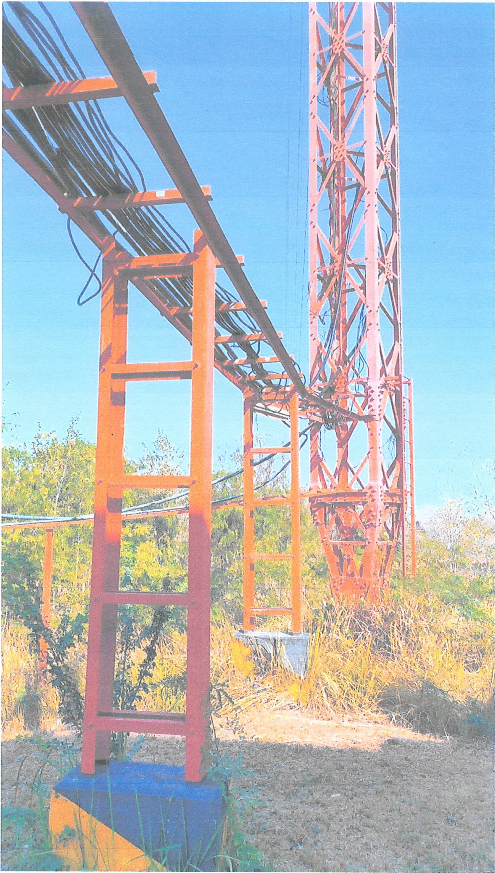
ภาพ : ฐานเสาอากาศและรางสายนำสัญญาณ