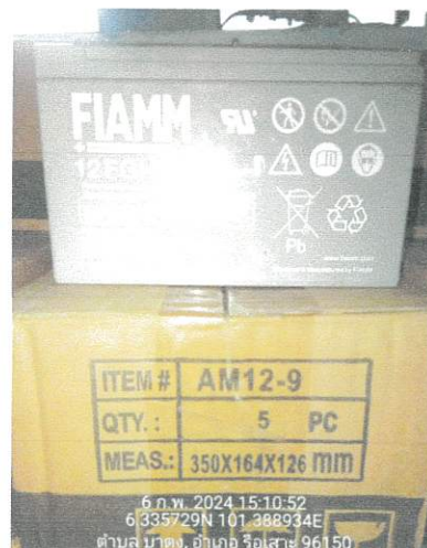
สถานีเครื่องส่งโทรทัศน์ จ.ยะลา จำนวน 96 ลูก (สถานีที่เก็บ สถานีวิทยุ จ.ยะลา)