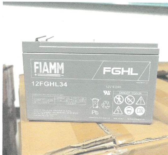
สถานีเครื่องส่งโทรทัศน์ จ.พังงา จำนวน 288 ลูก (สถานีที่เก็บ สถานีเครื่องส่งโทรทัศน์ จ.พังงา (ตะกั่วป่า))