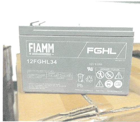
สถานีเครื่องส่งโทรทัศน์ จ.ระนอง จำนวน 96 ลูก (สถานีวิทยุ จ.ระนอง)