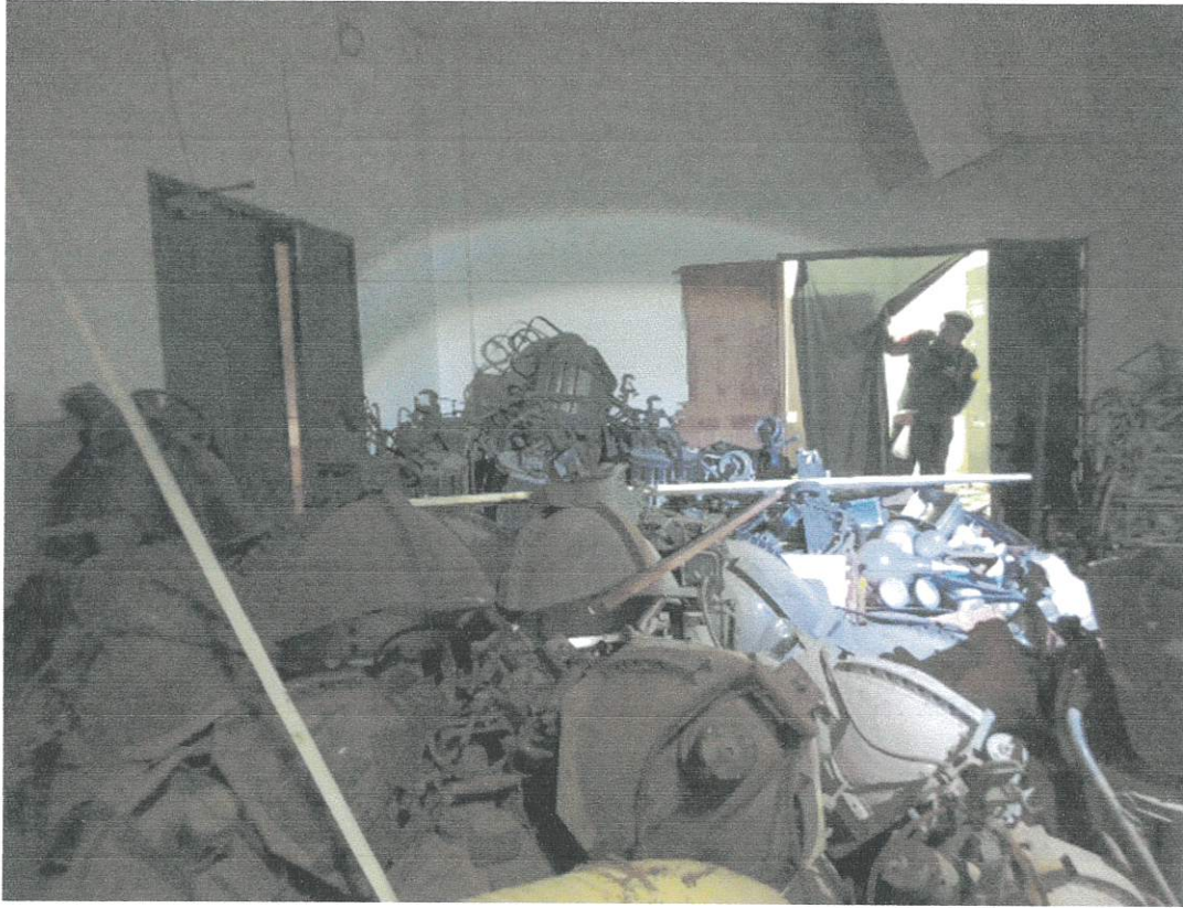
รูปภาพ (กลุ่มที่ 1)