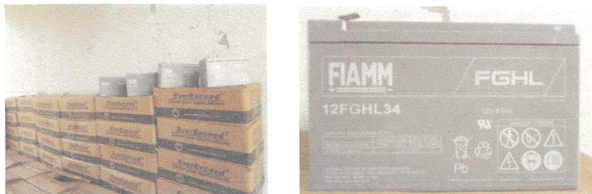
(ขนาด 12 v 9AH) จำนวน 320 ลูก

สถานีเครื่องส่งโทรทัศน์ จ.อุบลราชธานี จำนวน 416 ลูก (สถานีที่เก็บ สถานีเครื่องส่งโทรทัศน์ จ. จ.อุบลราชธานี )