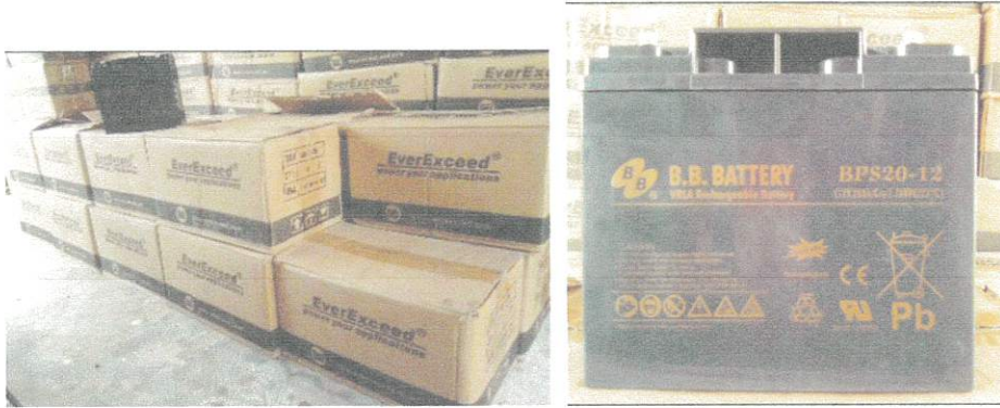
(ขนาด 12 v 20AH) จำนวน 76 ลูก