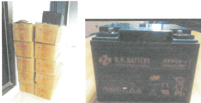
(ขนาด 12 v 20AH) จำนวน 20 ลูก