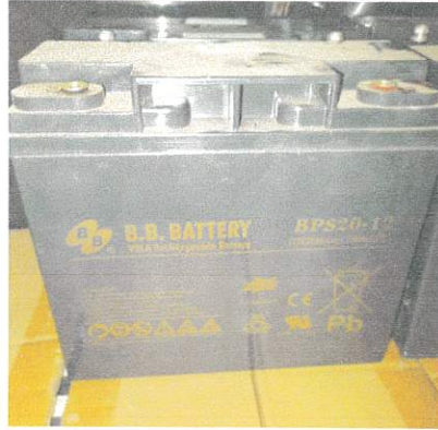
(ขนาด 12 v 20AH) จำนวน 96 ลูก