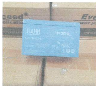
(ขนาด 12 v 9AH) จำนวน 422 ลูก

สถานีเครื่องส่งโทรทัศน์ จ.สกลนคร จำนวน 422 ลูก (สถานีที่เก็บ สถานีเครื่องส่งโทรทัศน์ จ.สกลนคร )