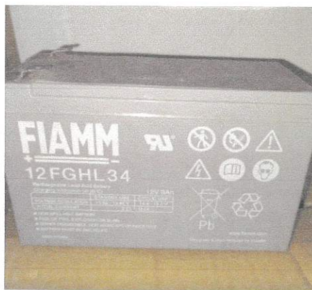
(ขนาด 12 v 9AH) จำนวน 96 ลูก

สถานีเครื่องส่งโทรทัศน์ จ.อุดรธานี จำนวน 192 ลูก (สถานีที่เก็บ สถานีเครื่องส่งโทรทัศน์ จ.อุดรธานี (อ.เพ็ญ))