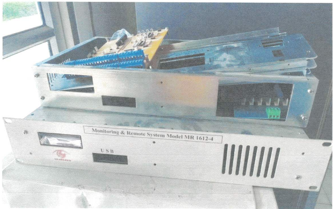
ภาพทรัพย์สินส่งคืน ศูนย์วิศวกรรมภาคตะวันออกเฉียงเหนือ